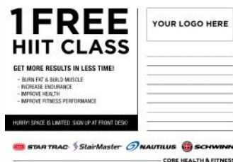
Free Class Post Card