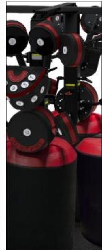
BoxMaster Quad w/ Kick Pads

ΠΛΗΡΟΦΟΡΙΕΣ ΓΙΑ ΤΟΝ ΕΞΟΠΛΙΣΜΟ ΜΠΟΡΕΙΤΕ ΝΑ ΔΕΙΤΕ ΕΔΩ