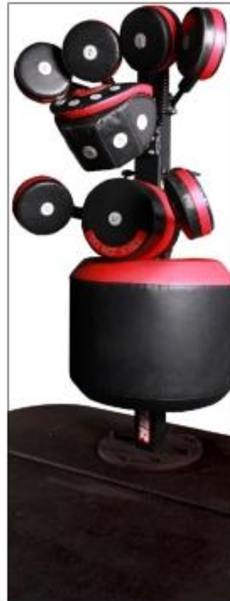
BoxMaster Tower with Base