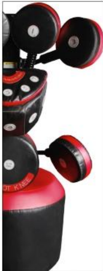
BoxMaster w/ Kick Pad